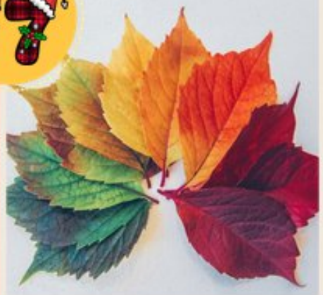
Vivre avec les Saisons

Au delà de consommer de saison c'est tout une philosophie de vie qui va avec chaque saison et donc des adaptations à faire. Chaque saison est liée à un organe et il y a des recommandations pour chacune d'entre elles. Vous trouverez parmi mes articles les 5 saisons détaillées. Par exemple pour la rate : https://anaisgirin.fr/la-rate-lorgane-des-intersaisons/