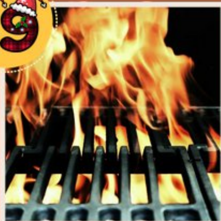
Les types de cuisson

Même si vous faites attention à la nature des aliments (neutre froide, fraîche, tiède, chaude) que vous apportez dans vos assiettes, la cuisson vient l'influencer.