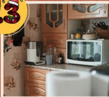
Le micro onde

Il est certes pratique mais son utilisation est fortement déconseillée (pas dans les textes anciens puisqu'il n'existait pas encore, 😬 mais dans une prolongation de la pensée chinoise) ils utilisent des ondes électromagnétiques de fréquences très élevées. Ces ondes agitent les molécules d'eau contenues dans les aliments générant des changements d'orientation moléculaires qui génère cette chaleur. Cette agitation continue au-delà du temps de chauffage. Cette cuisson diminue la teneur en vitamines et modifie la structure des acides aminés.