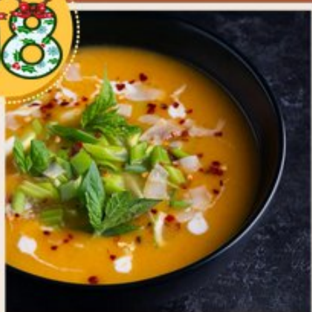
Le diner parfait

Le diner parfait se veut léger car généralement nous ne faisons aucun effort ensuite.